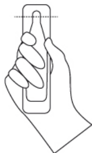
TAGLIARE SEGUENDO IL SEGNO TRATTEGGIATO