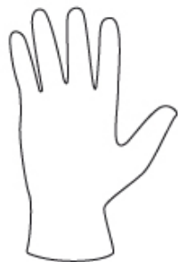
INDOSSARE IL GUANTO INCLUSO NELLA CONFEZIONE